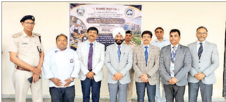
सोनीपत। निरीक्षण के लिए पहुंचे प्राधिकरण के सदस्य सचिव, सीजेएम एवं अन्य।

विधिक सेवाओं की समीक्षा और कारागार में कौशल प्रशिक्षण शुरू, बैठक में आमजन तक कानूनी सहायता पहुंचाने और विभिन्न योजनाओं को प्रभावी ढंग से लागू करने पर चर्चा