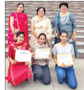
विजेता छात्राओं के साथ प्राचार्या।