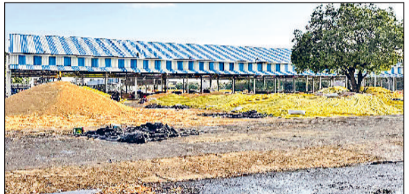
सोनीपत। नई अनाज मंडी में खुले में पड़ी गेहूं की ढेरियां, कुछ पर ढकी तरपाल।

कटाई के अलावा मंडी में पहुंच चुका गेहूं भीगने से किसान परेशान है। बता दें कि सोनीपत अनाज मंडी में अब तक करीब 30 हजार क्विंटल गेहूं की सरकारी खरीद हो चुकी है, लेकिन खरीद अनुसार फसल को पूर्ण उठान नहीं हो पा रहा है। गेहूं का कम उठान होने के कारण किसानों को उनकी फसल का भुगतान भी नहीं किया गया है। शहर की अनाज मंडी में करीब 25 हजार क्विंटल गेहूं पड़ा है। वहीं गन्नौर मंडी में करीब 7 हजार क्विंटल, खरखोदा व गोहाना मंडी में भी 10-10 हजार क्विंटल गेहूं की आवक हो चुकी है, लेकिन वहां अब तक खरीद शुरू नहीं हो सकी है। मंगलवार को रूक-रूक हुई बूंदबांदी के कारण मंडी व खेतों में गेहूं भीगने से किसानों की परेशानी बढ़ती नजर आई। सोनीपत सहित सभी मंडियों में गेहूं की आवक लगातार जारी है। सोनीपत मंडी की बात करें तो यहां खरीद एजेंसियां नमी ज्यादा बताकर गेहूं की खरीद कम कर रही हैं। सरकार की ओर से गेहूं की खरीद के बाद भुगतान तभी किया जाता है, जब मंडियों से गेहूं के बैग उठाकर गोदाम में भंडारण तक पहुंचा दिए जाते हैं। उसके बाद ही खरीद एजेंसियां किसानों को उनकी फसल का भुगतान करती हैं। उधर गोहाना, खरखोदा व गन्नौर मंडी समेत सभी खरीद केंद्रों में गेहूं की खरीद अब तक शुरू नहीं हो पाई है।