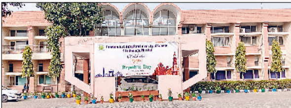
सोनीपत। मुख्य स्थित दीनबंधु छोट्टराम विज्ञान एवं प्रौद्योगिकी विश्वविद्यालय।